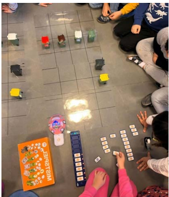
... Bluebot wird zum Müllwagen