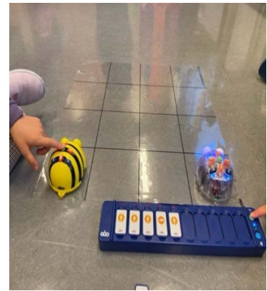
... fährt mit der Biene synchron...