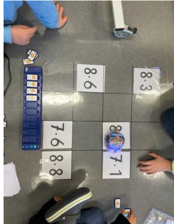
...1x1 einmal anders .....