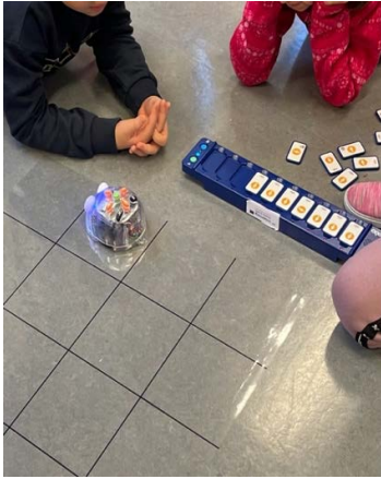
erste Schritte .....